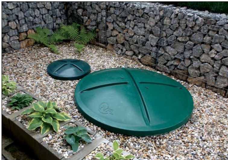
Domova čistiareň odpadových vôd

Podľa § 24 ods. 1 vodného zákona orgán štátnej vodnej správy môže z vlastného podnetu ním vydané povolenie na osobitné užívanie vôd zmeniť alebo zrušiť za určitých podmienok, najmä ak pri výkone povolenia na osobitné užívanie vôd dôjde k závažnému alebo opakovanému porušeniu povinností určených vodným zákonom alebo určených na jeho základe, alebo ak oprávnený nevyužíva vydané povolenie na osobitné užívanie vôd bez vážneho dôvodu dlhšie ako dva roky.