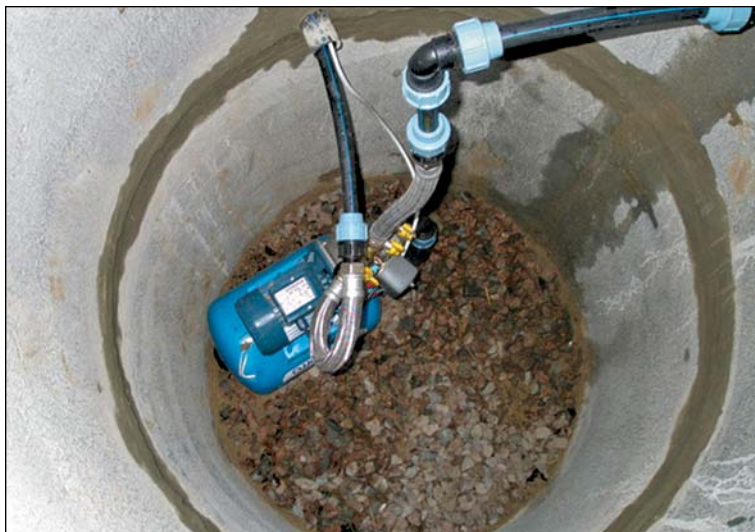
Studňa pri rodinnom dome

Podľa § 27 ods. 7 zákona č. 442/2002 Z. z. o verejných vodovodoch a verejných kanalizáciách a o zmene a doplnení zákona č. 276/2001 Z. z. o regulácii v sieťových odvetviach v znení neskorších predpisov (ďalej len „zákon č. 442/2002 Z. z.“) potrubie verejného vodovodu vrátane jeho vodovodných prípojk a na ne napojených vnútorných rozvodov nesmie byť prepojené s potrubím z iného zdroja vody, ako je vodárenský zdroj verejného vodovodu.