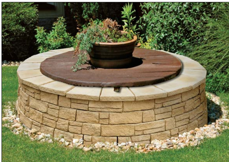
Studňa pri rodinnom dome